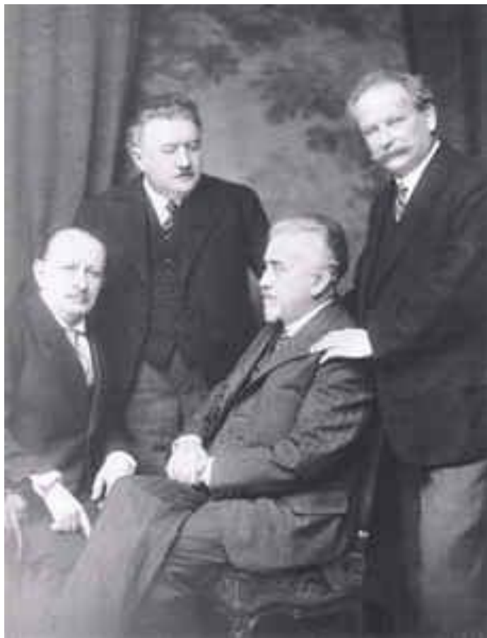
Obrázek 8: České kvarteto ve svém posledním obsazení